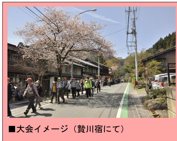
■大会イメージ(贄川宿にて)

各会場では基本的な感染症対策を行います。密を回避するために出発式等は行わず、受け付け後に各自スタートとなります。参加者は筆記用具(鉛筆・油性ペン等)の持参をお願いします。