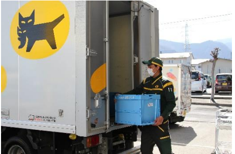
▲ベルクでヤマト運輸が商品を集荷

また、大滝地域の住民の方々には、通常は配達エリア対象外のネットスーパーからの購入といった、現状ではできない方法での買い物を体験いただきました。