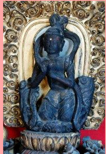
札所 14 番 長岳山今宮坊の飛天像

指定に関する詳細については、同日付で発表のあった埼玉県の報道発表資料をご参照ください。