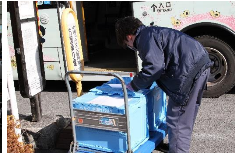
▲アズコムデータセキュリティが 路線バスで運ばれた商品を受け取る