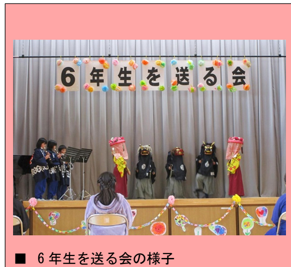
■ 6年生を送る会の様子

久那地域では、郷土の伝統芸能である獅子舞が传承されています。児童にこの伝統芸能を体験してもらおうと、獅子舞保存会の皆さまによる指導が毎年3年生を対象に実施されています。今年度も11月16日より練習が始まりました。練習の成果は、3月1日(水)6年生を送る会で全校児童と6年生保護者の方に披露しました。新年度になり4月16日(日)、地元葛城神社例大祭にて、3年ぶりに獅子舞奉披露をします。