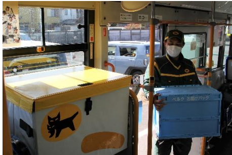
▲ヤマト運輸が商品を路線バスに積み込む